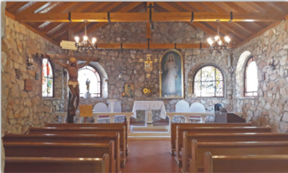
Kaplica w „Oazie Pokoju”

Odczuwając ulgę i radość, po dwóch dniach udałam się pod „Błękitny Krzyż”, aby podziękować Bogu za wszystko, co się dokonało. Będąc sama, mogłam spokojnie przeanalizować cały przebieg emocjonujących wydarzeń z obrazem. Cieszyłam się z pomyślnego zakończenia sprawy nie przeczuwając, że był to dopiero początek mojej trudnej wieloletniej posługi.