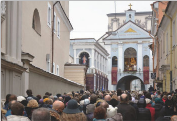
Obraz Jezusa Miłosiernego wystawiony w Ostrej Bramie w czasie uroczystości Święta Bożego Miłosierdzia. Widok współczesny.