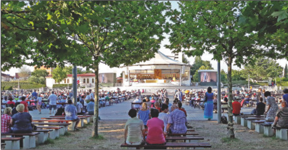
Pielgrzymi przy kościele św. Jakuba w Medjugorje