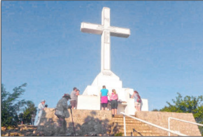
Góra Krzyża w Medjugorie