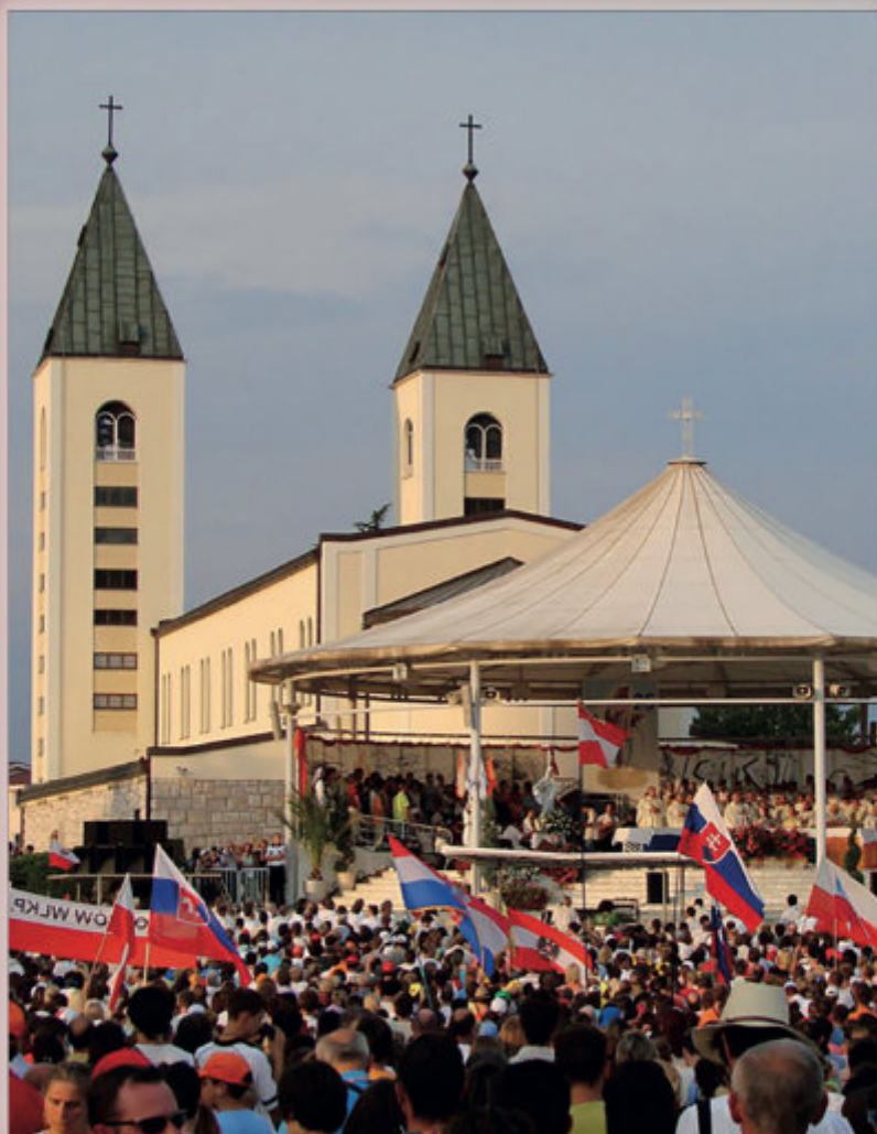
Medjugorie, kościół pw. Świętego Jakuba

„Jest to jedno z najbardziej żywych miejsc modlitwy i nawróceń w Europie...”