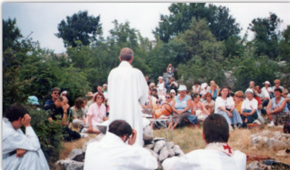
Rekolekcje w drodze do Medjugorie