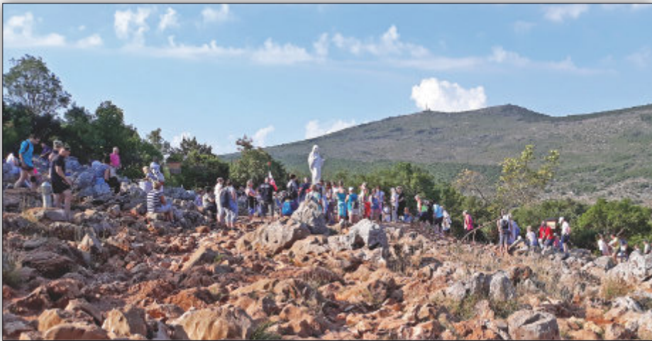
Pielgrzymi na „Górze Objawień” w Medjugorje

Potęga działania Bożego Miłosierdzia w Medjugorje ujawnia się poprzez atmosferę wszechobecnej modlitwy w kościele i poza kościołem. Świadczą o tym kolejki przy konfesjonałach i rozbrzmiewające na wzgórzach modlitwy nieustannie przybywających pielgrzymów z najdalszych zakątków świata, pragnących poznać i doświadczyć