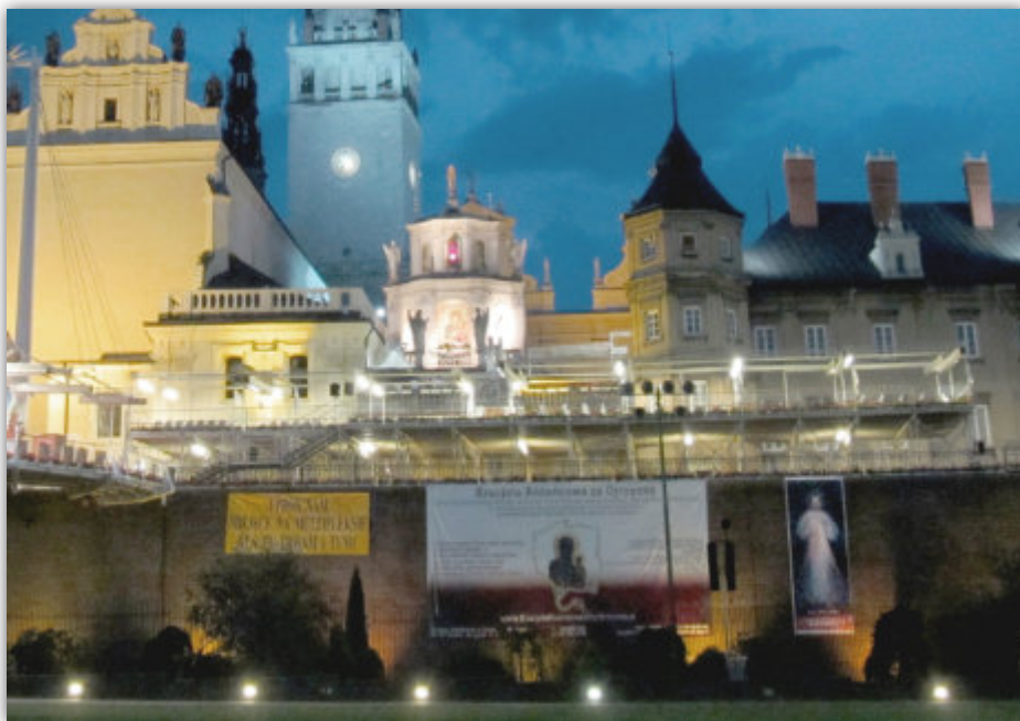
Obraz Jezusa Miłosiernego na Wałach Jasnogórskich